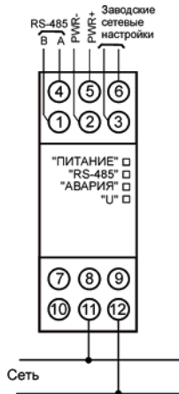
Рисунок Б.1 – Подключение прибора к однофазной сети

Замыкание клемм 3 и 6 приводит к восстановлению заводских сетевых настроек.