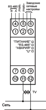
Рисунок Б.2 – Подключение прибора к однофазной сети через согласующий трансформатор